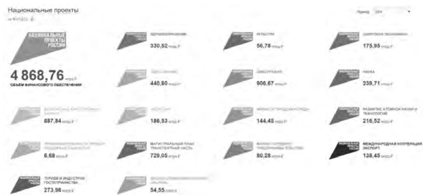
Рисунок 2 – Объем финансового обеспечения для проведения запланированных в рамках национальных проектов мероприятий на 2024 год.

Не стоит забывать в данном случае реализацию национальных проектов [25], направленных на сохранение населения, здоровья и благополучия граждан, создание возможностей для самореализации и развития талантов, комфортной и безопасной жизни, организацию эффективного труда и успешного предпринимательства, обеспечение научных и технологических прорывов, разработку и внедрение удобных и безопасных цифровых сервисов. Объем финансового обеспечения для проведения запланированных в рамках национальных проектов мероприятий на 2024 год 21 приведен на рисунке 2.