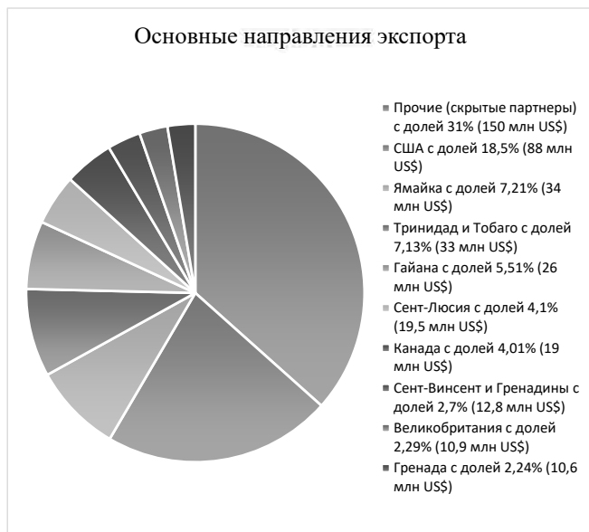
Рисунок 1 – Диаграмма распределения поставок продукции по основным направлениям экспорта в 2023 г.

Если сделать анализ экономических процессов и влияющих на них факторов в странах-членах Содружества наций, то можно выявить определенные тенденции и закономерности. Например, рассмотрим экономические тенденции Барбадоса (рис. 1).