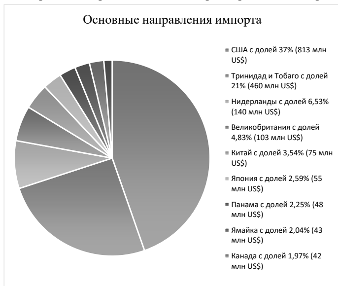
Рисунок 2 – Диаграмма распределения импорта продукции по основным направлениям импорта в 2023г.

внутри американского континента с осуществляется, в основном с страны Карибского региона. При этом, 39% экспорта страны – это нефтепродукты 38 .