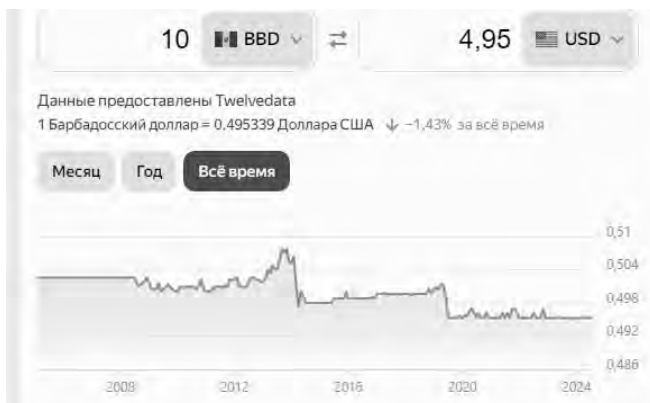
Рисунок 3 – график динамики соотношения барбадосского доллара к доллару США