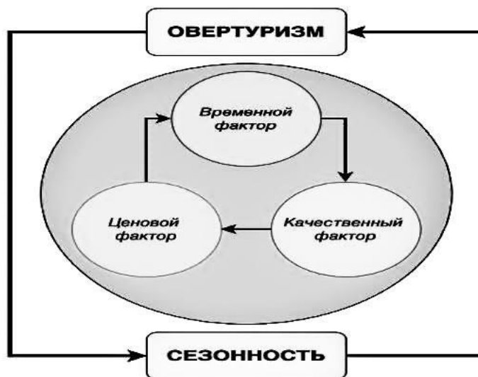
Рисунок 3 – Схема взаимодействия движущих сил

Далее удалось сформировать схему взаимодействия избыточного туризма и сезонности на базе данных факторов, что отражает диффузный характер взаимодействия явлений и их составляющих (рисунок 3).