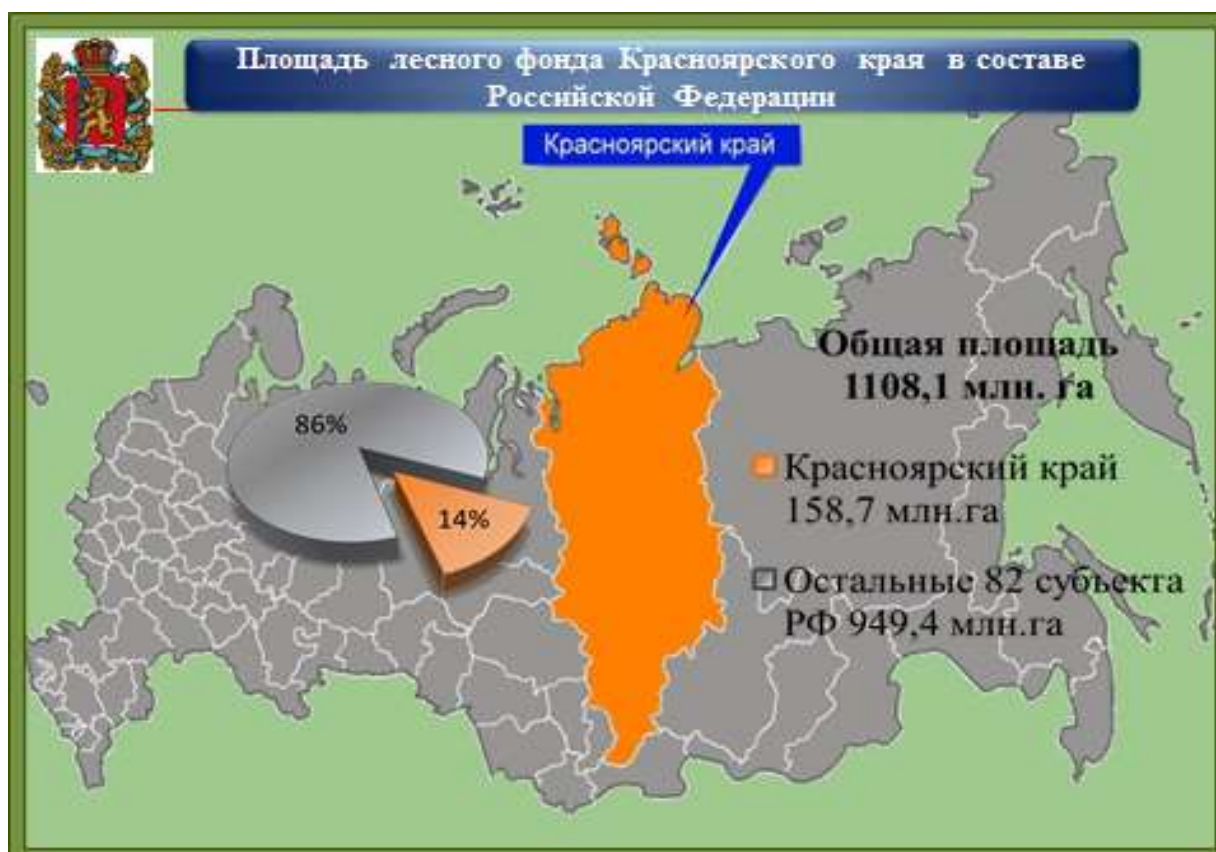
Рис. 1. Площадь лесного фонда Красноярского края

Общая площадь земель на 01 января 2018 года, на которых произрастают леса в Красноярском крае, составляла 164,0 млн га. Леса края располагаются на землях лесного фонда, землях особо охраняемых природных территорий, землях населённых пунктов, землях обороны и безопасности, землях иных категорий. По состоянию на 01 января 2018 года площадь земель лесного фонда составляла 158,7 млн га (рисунок 1) [8].