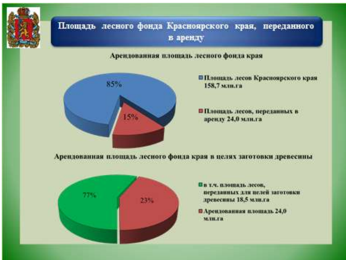
Рис. 2. Площадь лесного фонда Красноярского края, переданного в аренду

Красноярского края площадь лесов, переданных Министерством лесного хозяйства Красноярского края в аренду, составляет более 24,0 млн. га (рис. 2).