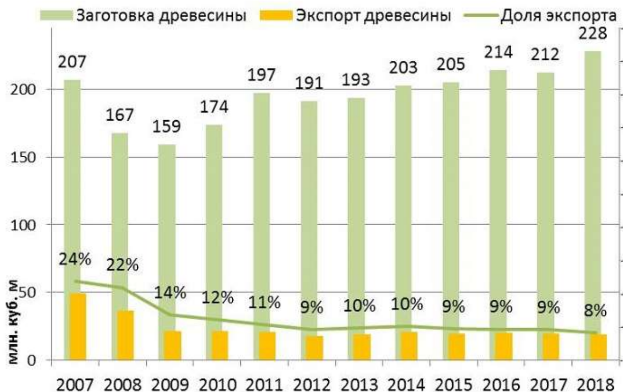
Рис. 3. Доля экспорта древесины России в 2007–2018 годах [13]

Лидером в России по поставкам необработанной древесины на рынок Китая является Хабаровский край (36%), на втором месте – Иркутская область (29%), на третьем – Приморский край (14%), на четвертом – Красноярский край (10%) от всего российского экспорта круглого леса в Китай (рис. 4).