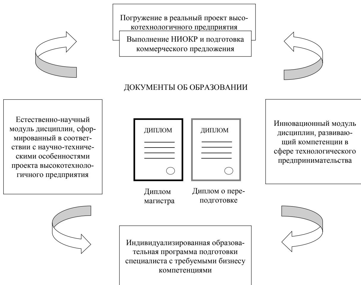
Рис. 1. Принципы построения образовательной модели

Схематично данные принципы построения образовательной модели представлены на рис. 1.