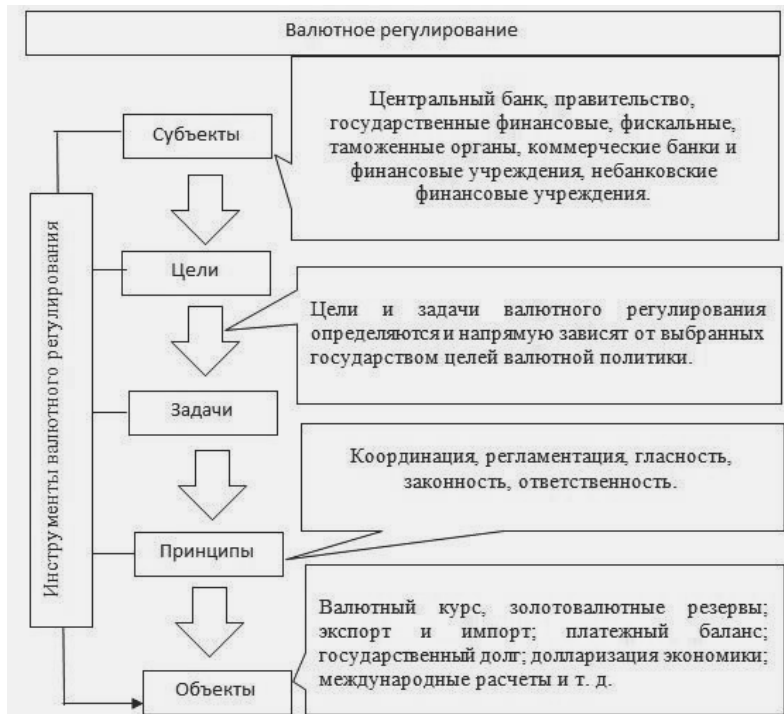
Рисунок 1. Валютное регулирование

Прежде чем дать собственное определение валютного регулирования, рассмотрим его структурные элементы, основными из которых являются: субъекты, объекты, цели, задачи, принципы и инструменты, что представлено на рисунке 1.