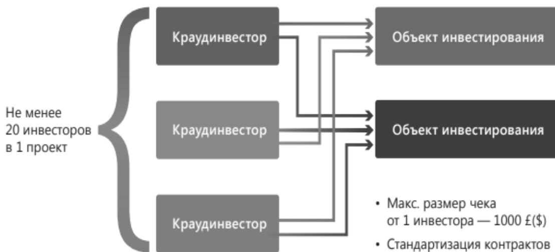
Рис. 2. Типовая модель краудинвестинга. Краудинвестинговая платформа [1]

Структура работы модели краудинвестинга представлена на рис. 2.