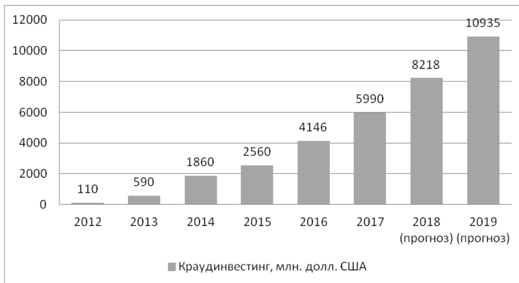
Рис. 4. Динамика краудинвестинга в мире за период 2012–2019 гг., млн долл. США [1]

лектуальный ресурс в будущий успех компании. Возможность участвовать в ее развитии становится для частного инвестора немаловажным мотивирующим фактором. Все эти аспекты находят подтверждение в положительной динамике объемов сделок краудинвестинга на мировом рынке. Аналитики прогнозируют значительное увеличение активности в этом сегменте в ближайшее время.