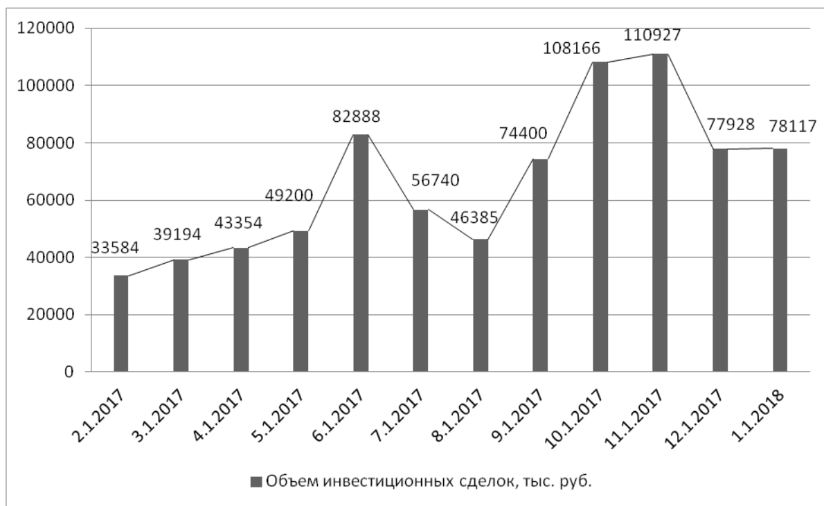
Рис. 3. Объем инвестиционных сделок на платформе StartTrack в 2017г., тыс. руб. [5]

Площадка StartTrack была создана в 2014 г. и позиционирует себя как инвестиционная платформа. Среди проектов, представленных на площадке, присутствуют краудлендинговые проекты и проекты, относящиеся к краудинвестингу. Данные по объему и структуре инвестиционных сделок на платформе StartTrack представлены на рис. 3.