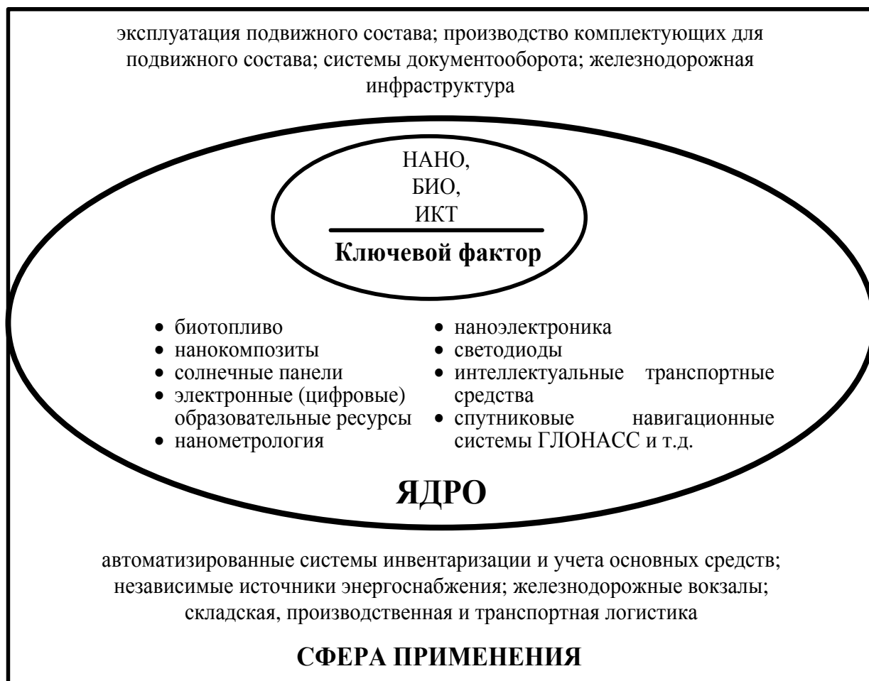
Рис. 1. Структура шестого технологического уклада применительно к железнодорожной отрасли

шой нагрузкой на транспортную систему и ростом логистических потерь и переход к локальной энергетике, архипелажным формам хозяйствования, микрокластерам, вертикальным кластерам).