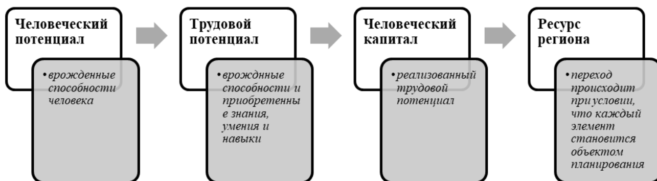
Рис. 1. Трансформация человеческого потенциала в ресурс для региона

Уровень развития любого региона непосредственным образом связан с ресурсным потенциалом, состоянием и степенью использования ресурсов региона, в том числе – трудовых ресурсов, которые первоначально проявляются в виде человеческого потенциала (рис. 1).