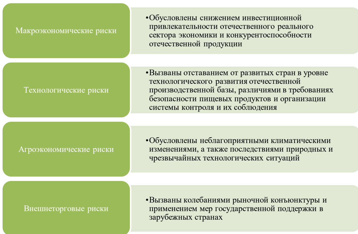
Рис.6. Виды рисков, негативно влияющих на стабильность уровня продовольственной безопасности [11]

Говоря о рисках, связанных с дестабилизацией уровня национальной безопасности, стоит отметить, что глобальные проблемы, выделенные создателем идей ESG-политики Кофи Аннаном (бывший генеральный секретарь Организации Объединенных Наций) [4], отчасти перекликаются с классификацией внутренних и внешних угроз национальной безопасности. О.А. Василенко по результатам проведенного анализа литературных источников выявила следующие угрозы национальной безопасности РФ, предварительно разделив их на внутренние и внешние [5]. К внутренним возможным причинам дисбаланса государственной системы она отнесла: