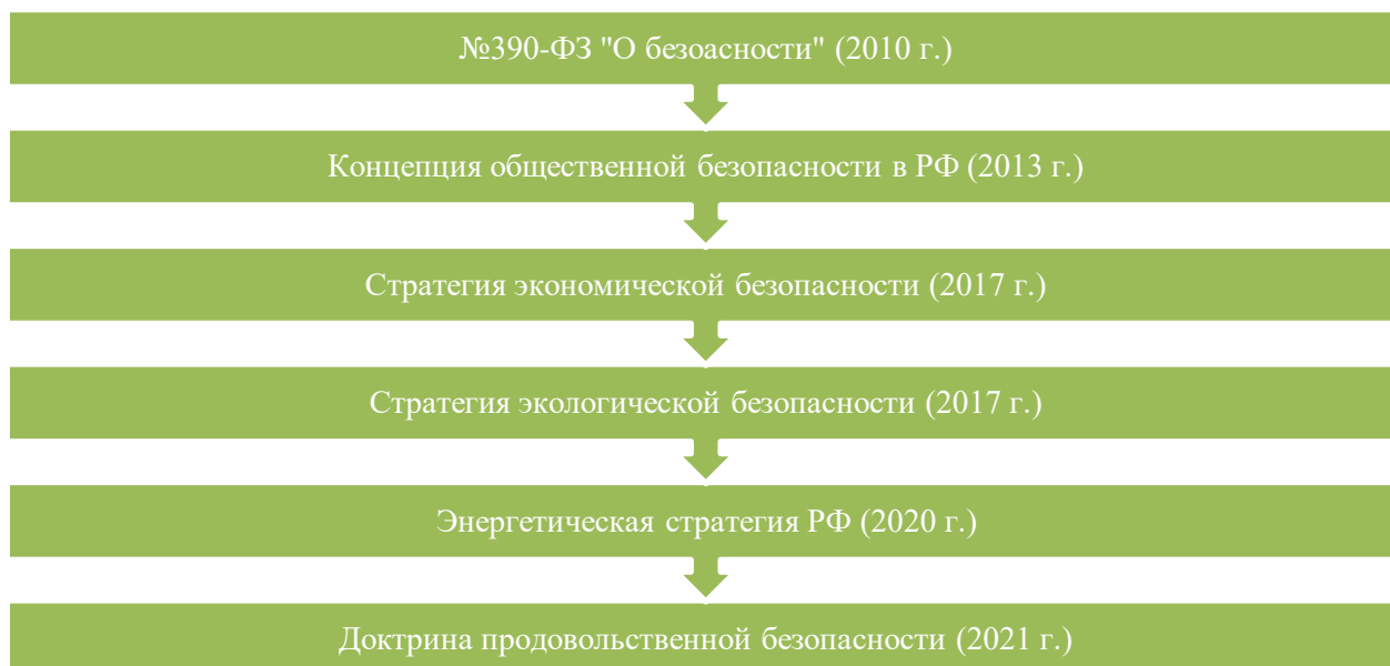
Рис. 2. Хронология утверждения нормативно-правовых документов, регламентирующих сферу обеспечения безопасности России в различных сферах [6]

Федеральный закон «О безопасности» от 2010 г. [3], помимо определения понятия «безопасность», содержит информацию о регламенте принятия решений о введении и совершенствовании мер по организации работы в сфере обеспечения безопасности России. В том числе в законе прописаны полномочия исполнительных и законодательных органов государственной власти в данной области. Документ также содержит положения, обозначающие круг работы Совета Безопасности РФ: его основные функции, задачи и полномочия. В свою очередь Совет Безопасности является конституционным совещательным органом, который формируется и возглавляется Президентом РФ. В число задач, за решение которых несут ответственность члены данного государственного органа, являются: