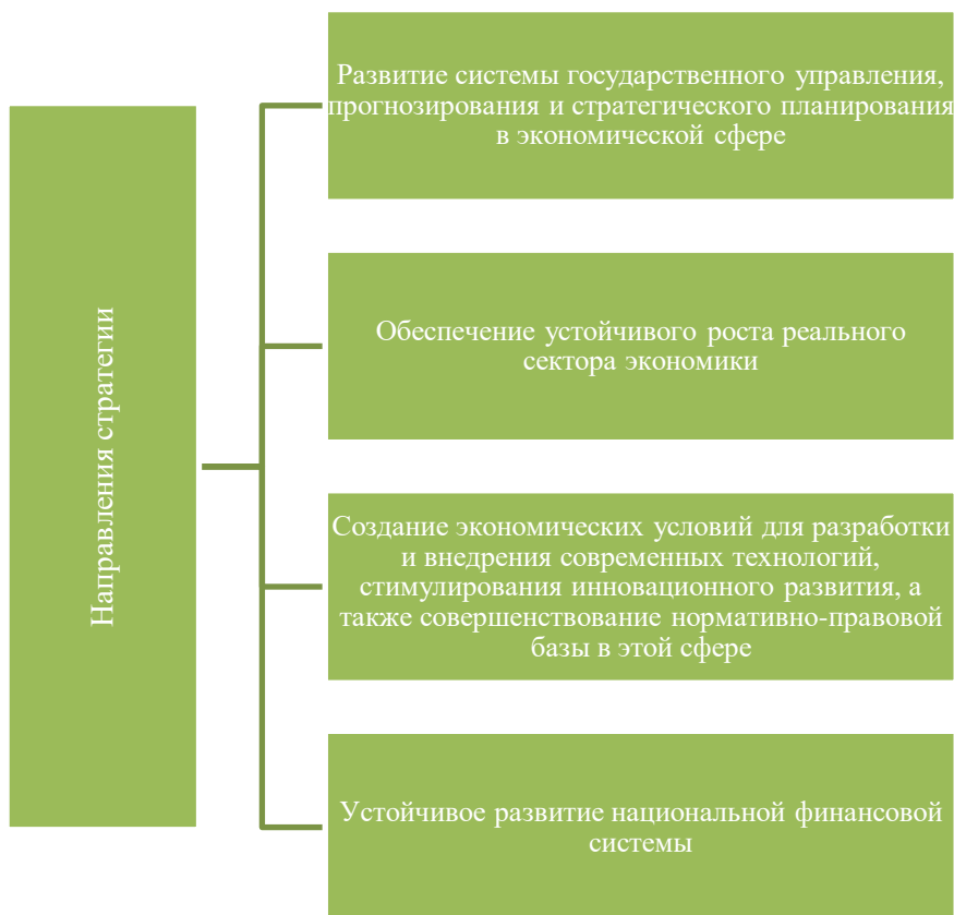
Рис. 4. Направления стратегии экономической безопасности РФ [8]

выполнимых действий. Основные направления С безопасности РФ представлены на Рис. .