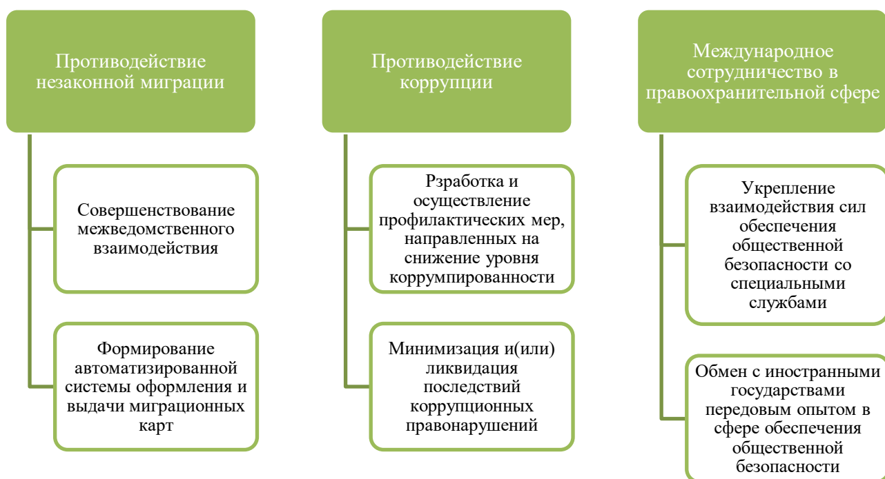
Рис. 3. Соответствие направлений деятельности практическим задачам по обеспечению общественной безопасности (фрагмент) [7]

Помимо прочего, документ также содержит описание задач, связанных непосредственно с конкретными направлениями деятельности в рамках общественной безопасности. Концепция также содержит описание этапов и сроков, в течение которых ожидается практическая реализация мер в данном сегменте. Фрагмент данной типологии представлен на Рис..