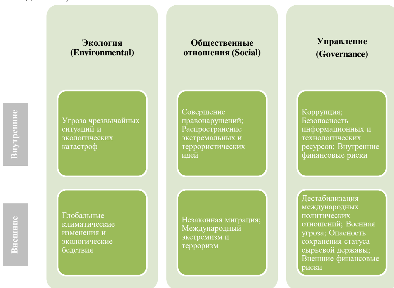
Рис. 7. Классификация угроз национальной безопасности РФ к сферам в ESG-политики

При детальном рассмотрении можно отметить, что выявленные угрозы национальной безопасности России можно органично переложить в секции, выделенные в рамках ESG-практики. Обширная, но емкая классификация позволяет сосредоточить внимание всего на трех основных аспектах, которые, тем не менее, являются основой не только эффективного производства, но и сохранения государственности. Классификация внутренних и внешних угроз национальной безопасности России представлена на Рис. (помимо факторов риска, выделенных О.А. Василенко [5], в классификацию также были включены риски, выявленные при анализе нормативно-правовой базы в рамках данного исследования).