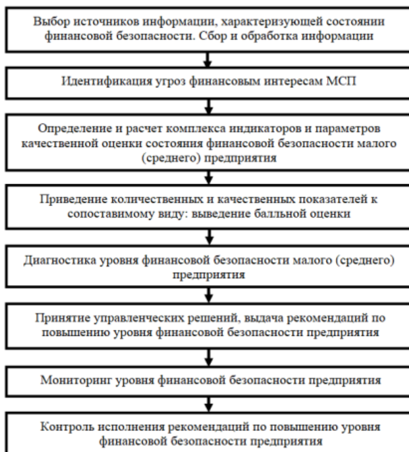
Рис. 5. Модель обеспечения устойчивости предприятий МСП в условиях экономических шоков [9]

Применение модели ограничивается доступностью информации о структуре рынка или крупных игроках отраслевого рынка. Особенно это актуально для сфер, где действуют закрытые предприятия. Кроме того, если продуктовая ниша занята преимущественно субъектами МСП, это также осложняет применение этой модели, поскольку такие организации не публикуют подробную информацию о результатах своей деятельности. Однако в процессе адаптации модели к конкретным условиям использования можно найти способы нивелирования сложностей получения информации о рынке.