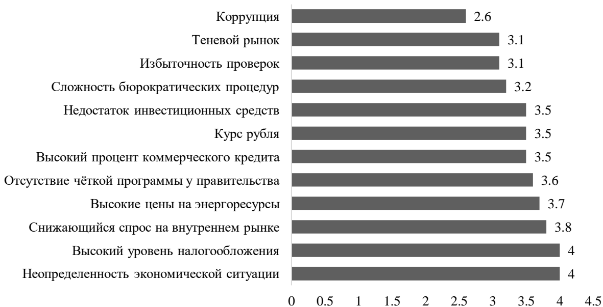
Рис. 2. Параметры, отрицательно влияющие на устойчивость субъектов МСП (по данным ВЦИОМ) [5]

Представленные значимые параметры и факторы внешней среды следует принимать во внимание как условия, на которые субъекты МСП не могут оказать влияния. Более того, именно они являются источниками экономических шоков, требующих наличия гибкого и эффективного адаптационного механизма, который обеспечит не только сохранение жизнеспособности экономического субъекта, но также позволит выявить и возможные направления для его развития.