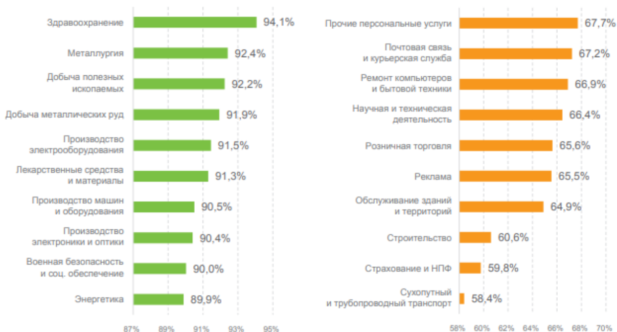
Рис. 4. Рейтинг отраслей деятельности субъектов МСП (по группам ОКВЭД) с наиболее высокой и наиболее низкой вероятностью дожития до возраста 36 месяцев [10]

Согласно статистическим данным, наибольшей стабильностью отличается сфера здравоохранения. Около 94 % малых и средних предприятий этой отрасли преодолели порог в 36 месяцев и продолжают функционировать [10].